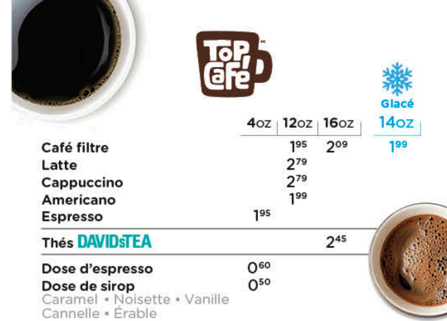
Image à titre indicatif. Taxes en sus. Selon la disponibilité en resto. Sur place ou pour emporter seulement, non disponible en commande en ligne ou en livraison.